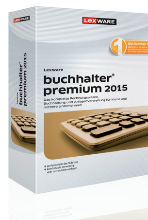
Lexware buchhalter premium

Netzwerkversion-Preis: € 499,90 zzgl. MwSt. Einmalkauf inkl. 365 Tage Aktualitätsgarantie