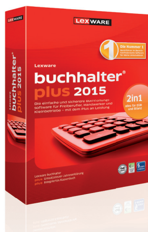
Lexware buchhalter plus

Einzelplatzversion-Preis: € 169,90 zzgl. MwSt. Einmalkauf inkl. 365 Tage Aktualitätsgarantie